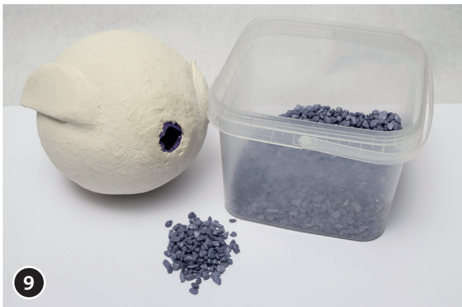
9 De opgedroogde papier-maché lichaam met steentjes/zand vullen.