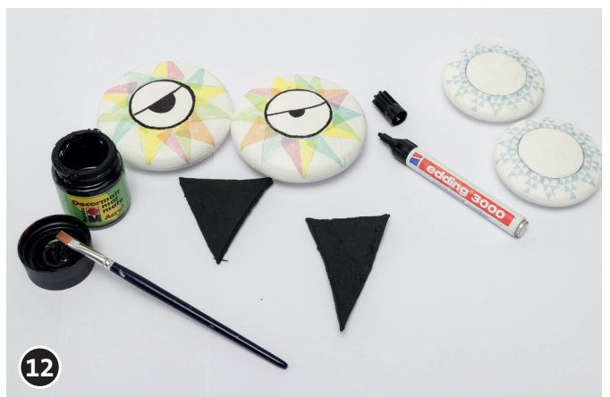
12 De ogen met de edding stift er op tekenen. De snavel met de zwarte acrylverf beschilderen. Dit alles weer goed laten drogen.