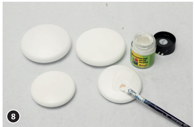
8 De tempex medaillons verven met de witte acrylverf.