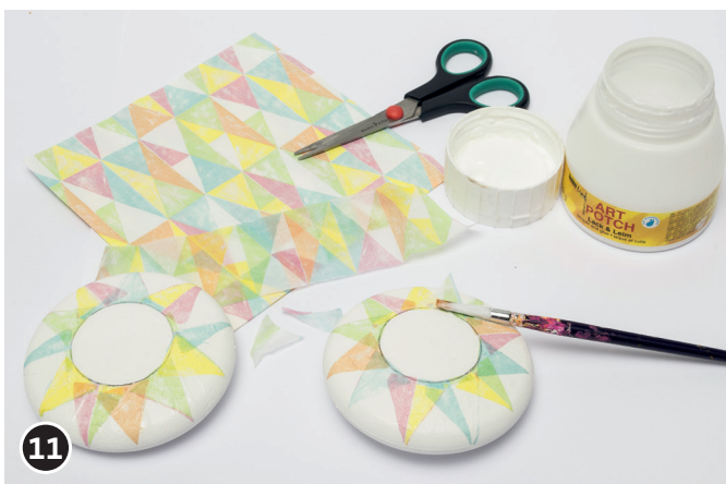
11 De servetten in de gewenste vorm knippen. De bovenste laag van de servet er af halen, deze met de servettenlijm op het medaillon plakken. Leg de servet op het tempex, met een kwast de lijm er op strijken (van binnen naar buiten). Het geheel goed laten drogen.