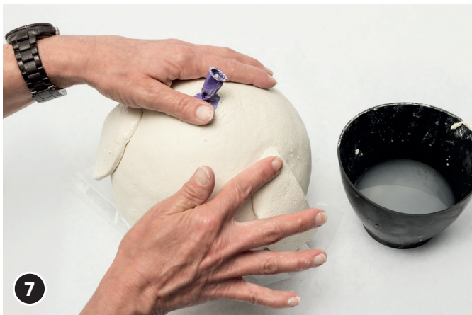
7 De vleugels met water aandrukken op het lichaam van de uil. Het geheel ca. 4 dagen laten drogen.