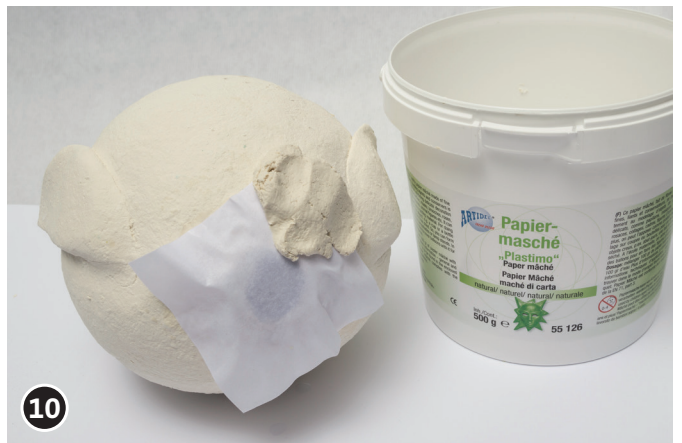
10 De opening met papier-maché sluiten, dit weer goed laten drogen.